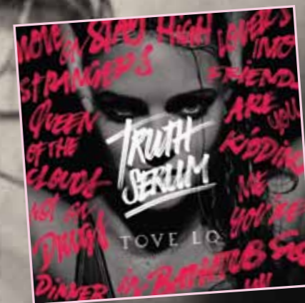
NYA EP:N "TRUTH SERUM"

– Jag kan vara rädd för att allt ska eskalera på ett sätt som gör att jag inte hinner med och tappar mig själv. Men jag tror inte att det händer. Jag har kommit hit för att jag är impulsiv, lyssnar på min magkänsla och inte fegar ur. Det är min styrka.